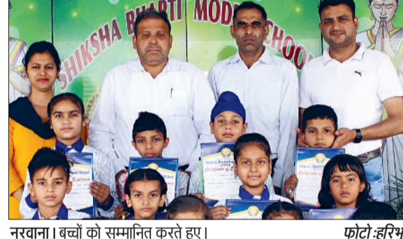
नरवाना। बच्चों को सम्मानित करते हुए।

टीम ने एक ओर महाविद्यालय की विशेषताओं, प्रमुखताओं का जिक्रकिया, उनकी सराहना की तो दूसरी ओर कमजोरियों और सुधार किए जा सकने की गुंजाइश को ध्यान में रखते हुए अपने बहुमूल्य