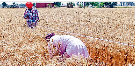
नरवाना। किसान से उसके खेत में क्रॉप कटिंग करवाते हुए कृषि अधिकारी।

कृषि विभाग नरवाना द्वारा क्षेत्र के सभी गांवों के खेतों में क्रॉप कटिंग का सैम्पल लिया जा रहा है। जिसमें विभाग द्वारा किसानों के खेत से एक मरला क्रॉप कटिंग का सैम्पल लिया जाता है जिसके बाद क्रॉप कटिंग से गेहूं की कटाई कर गेहूं का अलग से तोल किया जाता है जिसके आधार पर पुरे खेत की फसल का औसत निकाला जाता है। क्रॉप कटिंग के आधार पर पुरे खेत की फसल की निकली औसत के आधार पर ही किसानों की मुआवजा राशि तय की जाती है बताते कि यह मुआवजा