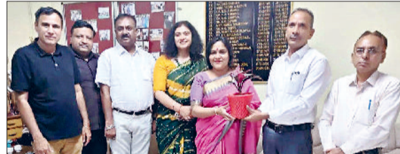
जीद। राजकीय पीजी कालेज में ऑडिट करती टीम।