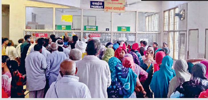
जीद। दवा खिड़की पर लगी मरीजों की भीड़।