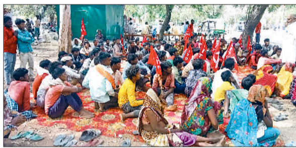
जीद। लघु सचिवालय के पास धरने पर बैठे भट्टा मजदूर।