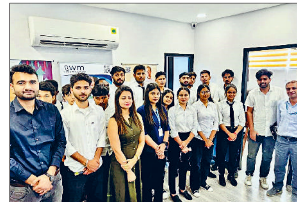
कैथल। बेरी विद मार्केट चंडीगढ़ का इंडस्ट्रियल दौरा करते एनआईआईएलएम विश्वविद्यालय के विद्यार्थी।