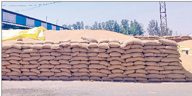
मंडियों में खुले आसमान के नीचे गेहूं।