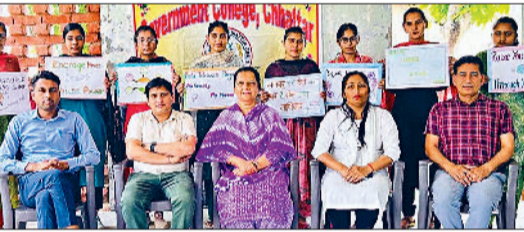
उचाना। प्रतियोगिता में विजेता प्रतिभागी।