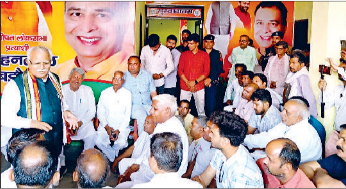
सफ़ीदों में भाजपा कार्यकर्ताओं की बैठक को संबोधित करते हुए सीएम मनोहरलाल।

पूर्व सीएम मनोहरलाल शुरुवार को सोनीपत लोस से भाजपा प्रत्याशी के जीद तथा सफ़ीदों कार्यालय में पहुंचे और जीद जिले की तीन विस भाजपा पार्टी पदाधिकारियों तथा कार्यकर्ताओं से चुनाव की लेकर बातचीत की। पीएम नरेंद्र मोदी के दस साल की सफलता और जो देश को दिशा दी गई है, उसके आधार पर तथा भाजपा के संकल्प पत्र के आधार पर आगे बढ़ेंगे। पूर्व सीएम मनोहर लाल कैबिनेट के फर्जी लेटर के बारे में पूछे गए सवाल पर कहा कि भाजपा सरकार ने भ्रष्टाचार करने वालों की हर तकनीक को फेल किया गया है। मुलजिम को भी पकड़ा गया है। कोई जमाना था जब ऐसा चल जाता था, अब ऐसा नहीं चलता है। कोई भ्रष्टाचार करने वाला आता है तो उसको पकड़ते हैं।