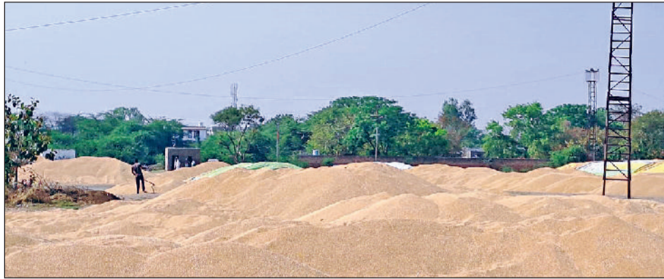
जीद। अनाज मंडी में खुले में रखा गेहूं।