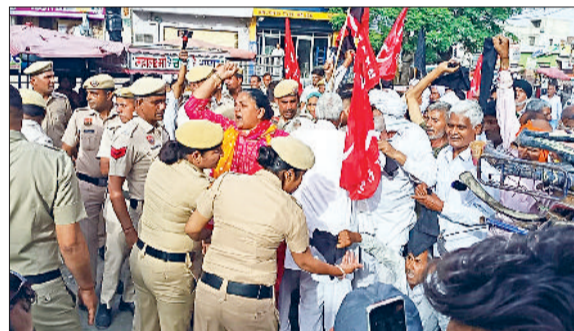
नरवाना। काले झंडे व नारेबाजी करके विरोध प्रदर्शन करते हुए किसान व मजदूर।

असंध मार्ग के बीचों बीच जाकर गिरा। इस दौरान एक कार चालक व एक मोटरसाइकिल सवार इसमें बाल बाल बच गए। अगर ज्यादा ट्रैफिक होता तो बहुत ज्यादा जान माल का नुकसान यहां हो सकता था। शेड सड़क के बीचों-बीच गिरने से वाहनों की लंबी कतारें लग गईं। मार्ग से गुजरने वाला हर व्यक्ति इसे देखकर हैरान हो रहा था कि इतना भारी भरकम शेड किस तरह इतनी दूर से उड़ कर सड़क के बीचों-बीच आ गिरा।